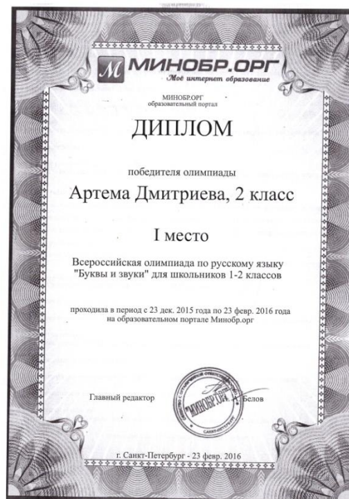
Дистанционная всероссийская олимпиада по русскому языку «Буквы и звуки»