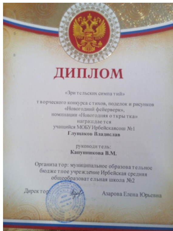
Муниципальный творческий конкурс стихов, поделок и рисунков «Новогодний фейерверк».