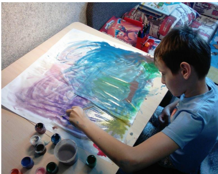
Изотерапия. Техника «Карта моего внутреннего мира»