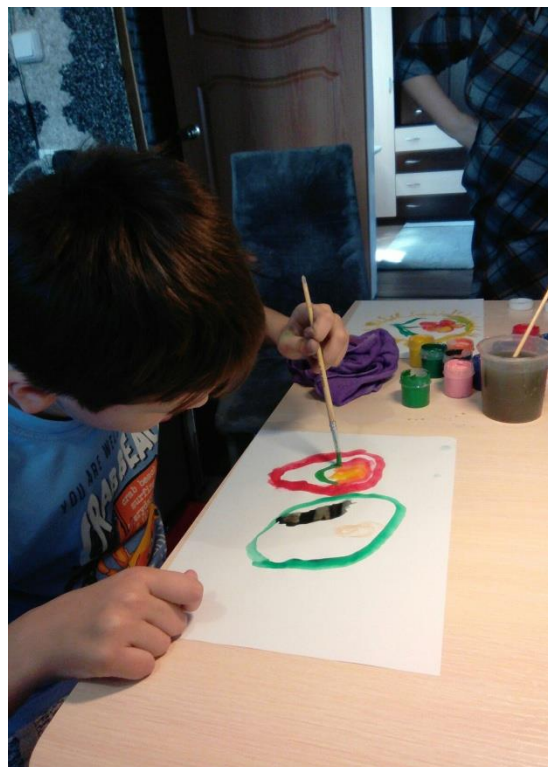
Изотерапия. Техника «Мандала»